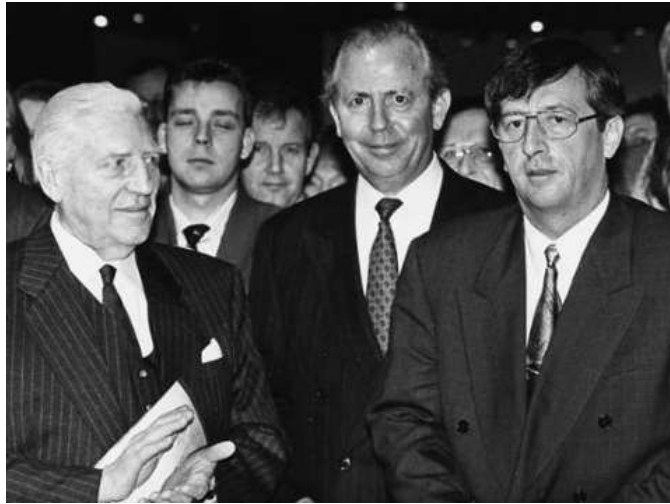
P. Werner (links) mit seinen politischen Ziehsöhnen J. Santer und J.-C. Juncker